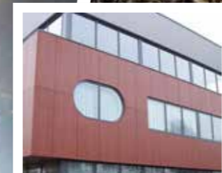
Project, montage & meer

Webru biedt een groot aantal diensten, waarvan modulair gebruik kan worden gemaakt. Ontwerpen en turnkey opleveren of het tekenwerk aangeleverd krijgen en slechts enkele onderdelen van het bouwproces uitvoeren; de opdrachtgever bepaalt per project van welke diensten gebruik wordt gemaakt.