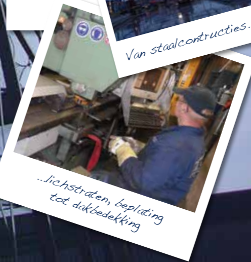
...lichtstraten, beplating tot dakbedekking

Webru, onderdeel van de ProFerro Groep, onderscheidt zich doordat men goed in staat is het volledige pakket met betrekking tot de complete constructie aan te bieden. Door ervaring en ambitie is het aantal diensten dat deze onderneming aanbiedt enorm gegroeid, zodat Webru de opdrachtgever ook Turn Key projecten kan aanbieden.