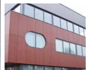
Projekt, Montage & mehr

Webru hat langjährige Erfahrung im Modellieren mit dem sogenannten Building Information Model (BIM), bzw. den Modellen aus Tekla. Durch die Zusammenarbeit mit dem Auftraggeber und den Bauunternehmen in diesem Modell werden Kosten eingespart, denn Fehler werden rechtzeitig identifiziert und falls nötig, bereits bevor die Produktion eines Bauteils begonnen hat, behoben. Die technischen Zeichner von Webru haben 2011 den Tekla BIM Award – Benelux im Bereich BIM – Auftragnehmer – Ingenieure gewonnen.