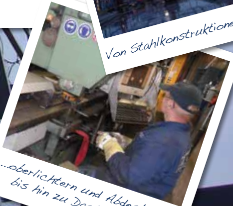
...Oberlichtern und Abdeckungen bis hin zu Dachdeckungen

Webru, Teil der Pro-Ferro Gruppe, unterscheidet sich dadurch, dass es in der Lage ist, das gesamte Paket bezüglich der kompletten Konstruktion anzubieten. Aufgrund der Erfahrung und Ambitionen ist die Anzahl der Dienste, die dieses Unternehmen anbietet, sehr stark gewachsen, sodass Webru dem Auftraggeber auch schlüsselfertige Projekte anbieten kann.